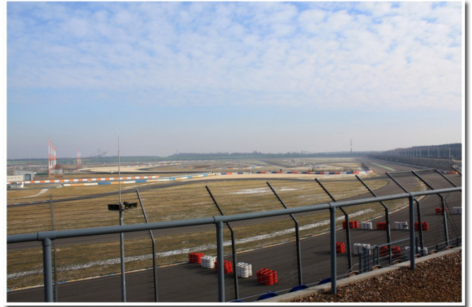
Perfekter Blick von der Seitentribüne H auf die Rennstrecke!